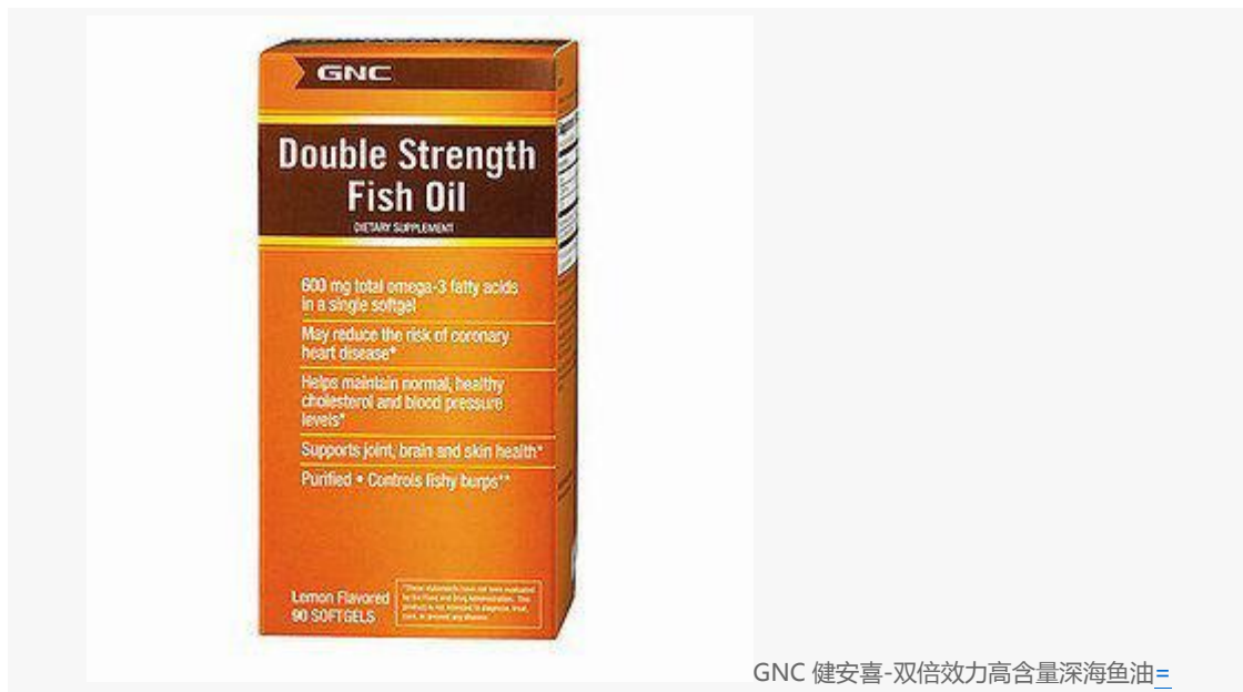
GNC 健安喜-双倍效力高含量深海鱼油